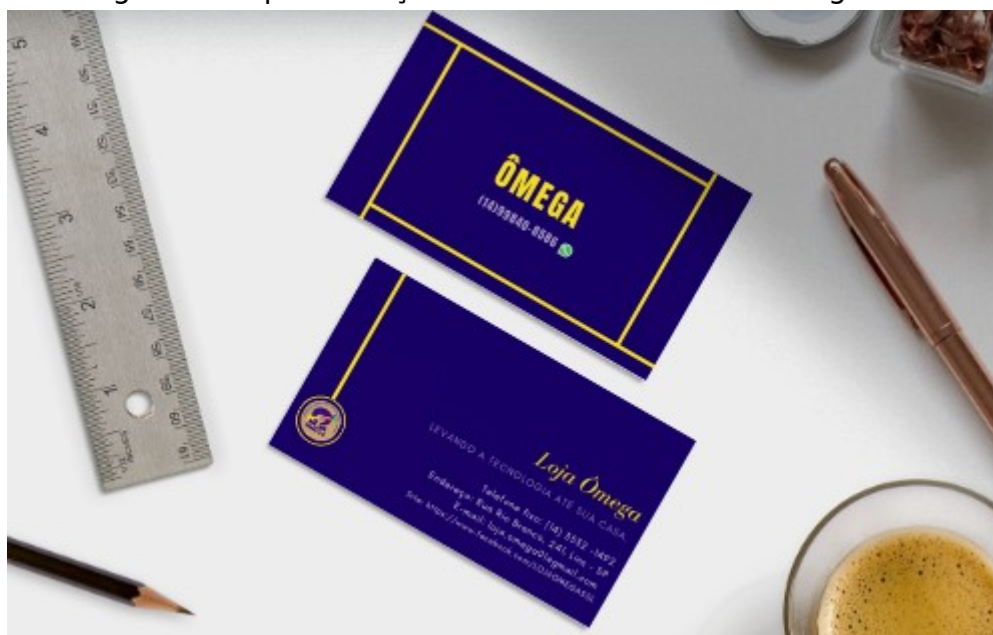
Figura 1: Representação do Cartão de Visitas Ômega